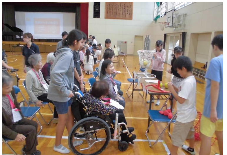
いっしょに遊みましょう。