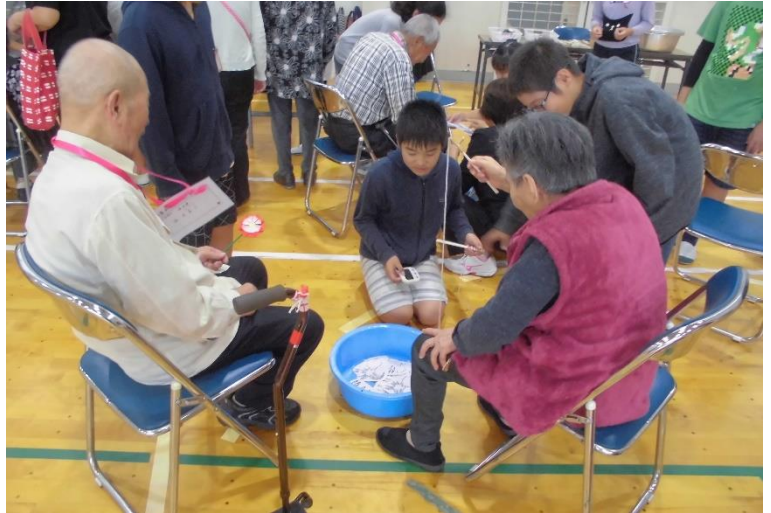
何匹釣れたかな・・・

今年初めて、田原小児童による企画運営の活動を取り入れましたが、参加したお年寄りに大変好評で、「ほんとに楽しかった。」「ありがとう。」という言葉が数多く聞かれました。