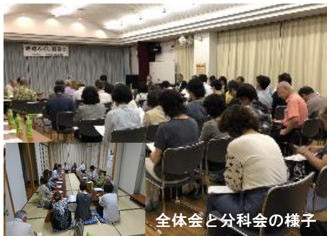
全体会と分科会の様子

今年は、平成 26 年度に策定した田原地域住民福祉計画「共に生き、ともに支え合いのできる安心なまちづくり」の ①高齢者対策 ②子供対策 ③災害対策の 3 つのテーマについて見直しを実施、田原の現状、課題等についてグループ別に意見交換し、新たに令和元年度から令和 3 年度の計画で「地域共生社会の実現に向けた地域力の強化」をスローガンに田原地域住民福祉活動計画が承認されました。