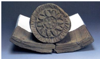
大杉廃寺から出土した軒丸瓦・軒平瓦