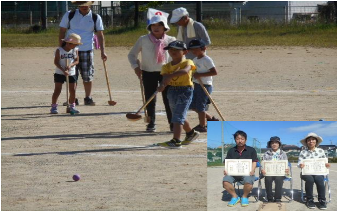
グラウンドゴルフ大会の様子と上位入賞者の皆さん

10月6日(日) 桜ヶ丘中学校グラウンドで第27回田原ふれあいグラウンドゴルフ大会が開催されました。保育園児・小学生から90才のお年寄りまで83名の参加者があり、晴天に恵まれた絶好のスポーツ日和に楽しくプレーが行われました。ホールインワン達成者23名と成績優秀者上位10名が表彰され、和気あいあいの中無事終了しました。選手の皆さんお疲れ様でした。関係者の皆さんご協力ありがとうございました。