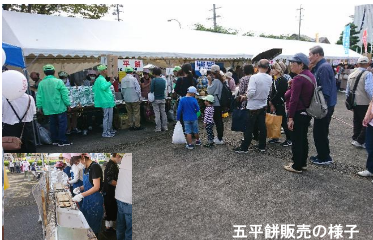
五平餅販売の様子

翌 20 日は秋晴れの下、関市民健康フェスティバルが文化会館市民広場・大ホール他で開催され大勢の人々で賑わいました。田原支部恒例の五平餅の販売に関係者一同奮闘した結果、午後 1 時には予定数量 1,100 本を完売することができました。ご支援を頂きました関係者の皆さんありがとうございました。